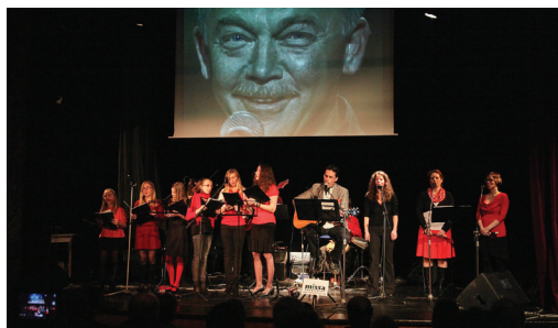
Koncert hudební skupiny Missa - Karel Kryl Revival v divadle Mana

Hlavním námětem X. ročníku festivalu proti totalitě Mene Tekel byla Mládež v době ne-svobody .