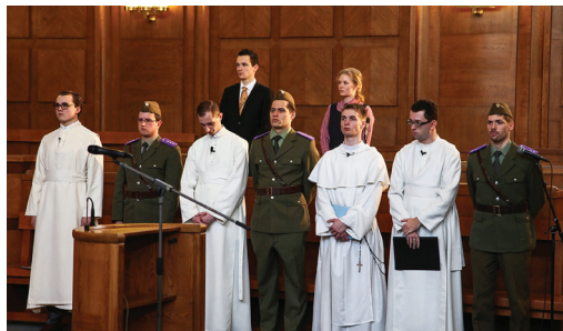
Na rekonstrukci procesu se kromě režiséra J. Řeřichy podíleli historici A. Šimánková, A. Kašková a A. Kýr

Ročník festivalu Mene Tekel začal již 21. února 2017 brněnským prologem, určeným široké veřejnosti. Díky spolupráci s Konfederací politických vězňů ČR, Vojenským historickým ústavem a Americkým fondem si mohla veřejnost prohlédnout proslulou věznici Cejl. Na tamní popravistiště byly položeny květiny a v atomovém krytu 10-Z proběhla vernisáž výstavy komiksů o třetím odboji.