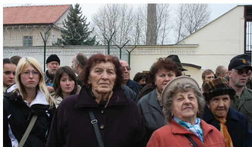
Společná cesta bývalých politických vězeňkyň a studentů zabývajících se historií do pardubické věznice

Týden před zahájením druhého ročníku festivalu proti totalitě, zlu a násilí Mene Tekel jsme v pasáži Magistrátu hl. m. Prahy představili program festivalu a otevřeli jsme výstavu dětské výtvarné soutěže na téma Totalita, zlo, násilí . Výstava byla přístupná návštěvníkům až do 9. 3. 2008. V průběhu festivalového týdne se promítaly Příběhy železné opony z produkce České televize Ostrava.