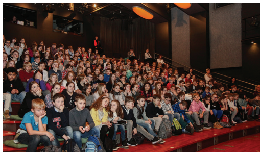
Každoroční úspěšná spolupráce s divadlem Minor: interaktivní představení Demokracie