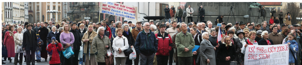
Manifestace proti totalitě na Staroměstském náměstí v Praze v roce 2007

Senát Parlamentu ČR, Novoměstská radnice, Lotyšské velvyslanectví v ČR, Knihovna Václava Havla, kino MAT, Ekumenická rada církví, Spolek Dcery 50. let, Česká televize, Český rozhlas Plus.