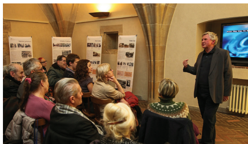
Režisér a dramatik V. Venclík představil stříhový film Národ sobě a medailonky perzekvovaných osobností

V pondělí 25. února 2013 začal týdenní program 7. ročníku festivalu Mene Tekel. Tentokrát jsme se vzhledem k výročnímu datu sešli již při zahájení protitotalitního týdne u pamětní desky v Nerudově ulici při pietní akci připomínající 65. výročí pochodu studentů za svobodu a demokracii na Pražský hrad dne 25. února 1948.