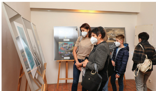
Výstavní projekt Cesty ke svobodě