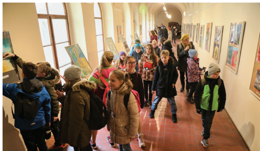
Účastníci výtvarné soutěže na vernisáži výstavy Cesta ke svobodě