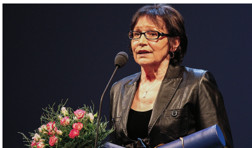
Dámou české kultury se stala legenda hudební scény Marta Kubišová

Hlavní téma IX. ročníku festivalu znělo Rodina v době nsvobody .