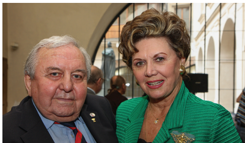
Dvojnásobná mistryně světa v krasobruslení Ája Vrzáňová a držitel stříbrné medaile ze ZOH 1948 Augustin Bubník

Třetí ročník mezinárodního festivalu Mene Tekel se stal oficiální kulturní doprovodnou akcí českého předsednictví v Radě Evropy. Festival jsme zahájili v pondělí odpoledne již tradičně vernisáží výstavy v Křížové chodbě Karolina na Univerzitě Karlově.