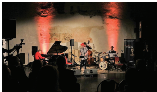
Slavnostní jazzový koncert

Patnáctý ročník festivalu s podtitulem Právo na právo reflektoval otázky diskriminace a pronásledování osob z hlediska rasy, víry, politického či jiného smýšlení, národního nebo sociálního původu.