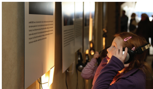
Mene Tekel zaměřuje svoji pozornost především k mladé generaci